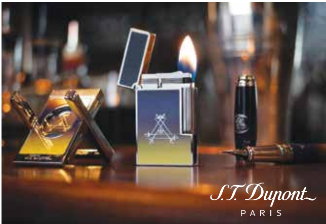
S.T. Dupont x Montecristo "La Nuit" limited edition collection. 「都彭」x Montecristo「La Nuit」限量版系列。