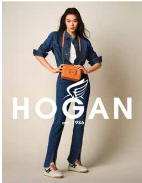
Shoes and handbag by Hogan. 「Hogan」鞋履及手袋。

本集團擁有港幣二十二億六千二百三十萬元之現金淨額。本集團定能藉此強健之財政狀況，應對全球可能面對之經濟衰退風險及艱難之零售環境。