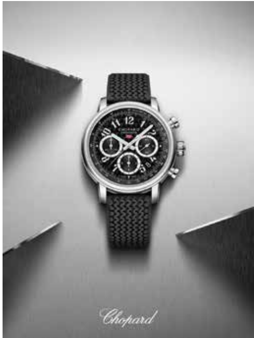
Chopard watch. 「蕭邦」腕錶。

台灣市場仍為本集團於本年度內表現最強勁之市場，銷售額及盈利均創記錄之新高。然而，由於總統選舉將定於二零二四年一月舉行，下半年度之市場情況可能會受到政治活動所影響。