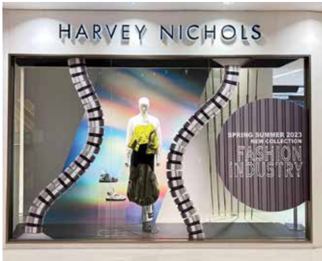
Fashionwear at Harvey Nichols. 於「Harvey Nichols」的時裝。