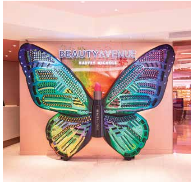
Beauty Avenue, the new beauty retail concept. 「Beauty Avenue」一站式化妝美容全新概念。

本集團預期本財政年度香港零售市場將極為艱難。由於日本及歐洲等其他市場之貨幣疲弱及給予旅客退稅，致使其名貴商品之零售價格較香港顯著便宜，故本地消費者積極外遊及消費。此外，深圳已成為極受香港消費者歡迎之旅遊消費熱點，因其食品、服務及一般商品之品質較港相若或更佳，而價格卻更為低廉。在旅遊消費方面，中國旅客縮短了在香港之行程，及並不再像疫情前以購物為主導。