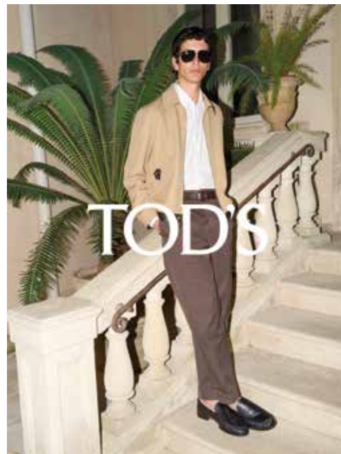
Shoes by Tod's. 「Tod's」鞋履。