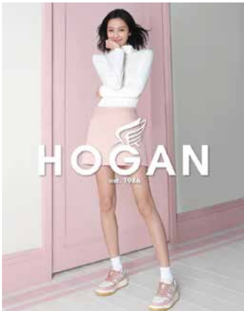
Shoes by Hogan. 「Hogan」鞋履。

本集團擁有港幣二十六億七千零五十萬元之現金淨額。本集團定能藉其強健之財政狀況，應對艱難之零售環境及潛在之經濟衰退風險，並把握新投資機會，以分散及擴大其盈利基礎。