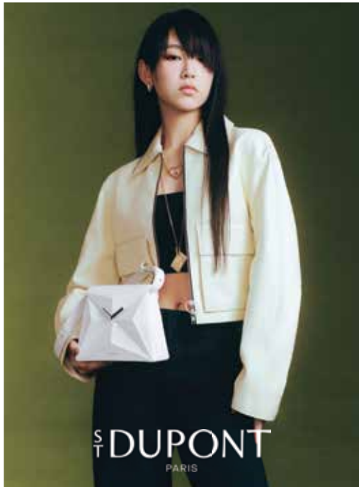
S.T. Dupont new women's leather goods "X-Bag" collection. 「都彭」全新女士皮具「X-Bag」系列。