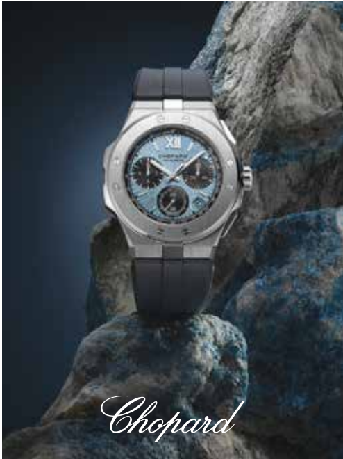
Chopard watch. 「蕭邦」腕錶。

台灣市場將充滿挑戰，因當地消費者亦積極前往日本旅遊，由於日元疲弱及給予旅客退稅，致使其名貴商品之零售價較台灣顯著便宜。