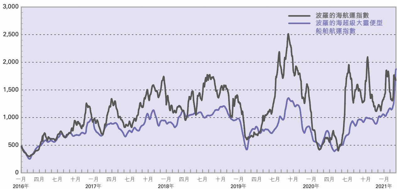
波羅的海航運指數及波羅的海超級大靈便型船舶航運指數

於COVID-19全球大流行病持續，並對全球不少行業及市場造成重大及負面之影響下，散裝乾貨航運市場於二零二零年再次面對充滿挑戰之一年。縱使散裝乾貨航運市場並非如航空業或休閒設施等之其他行業受到重創，但各國為遏止COVID-19傳播而設之封鎖無可避免地減慢大部份之經濟活動及工業生產，首先於中國開始，其後漫延至全球。此負面情況已導致散裝乾貨商品需求減少，包括鐵礦砂、煤炭及若干次要散裝貨物，及於二零二零年初影響到散裝乾貨航運市場情緒。鑒於商業信心被突然侵蝕，波羅的海航運指數於二零二零年一月以1,090點開市，並於二零二零年上半年於COVID-19全球大流行病爆發期間下滑至二零二零年五月之393點。於二零二零年下半年，受到尤其中國之鐵礦砂進口，以及新造船舶供應有限及根據國際海事組織二零二零年新規定下舊船舶拆卸有所增加之推動，全球海運貿易活動開始回復。波羅的海航運指數之良好勢頭持續，並於二零二零年下半年繼續攀升，於二零二零年十月上升達至全年最高之2,097點，及於二零二零年十二月底以1,366點收市。二零二零年波羅的海航運指數平均為1,066點，對比二零一九年為1,353點。