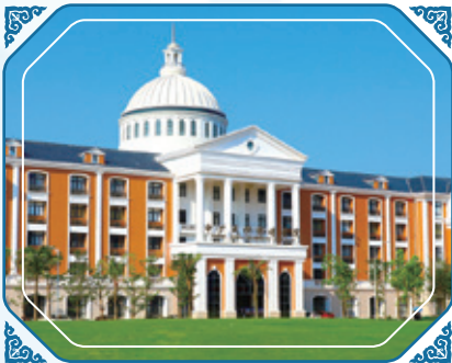
海口經濟學院及海口經濟學院附屬 藝術學校加入本集團