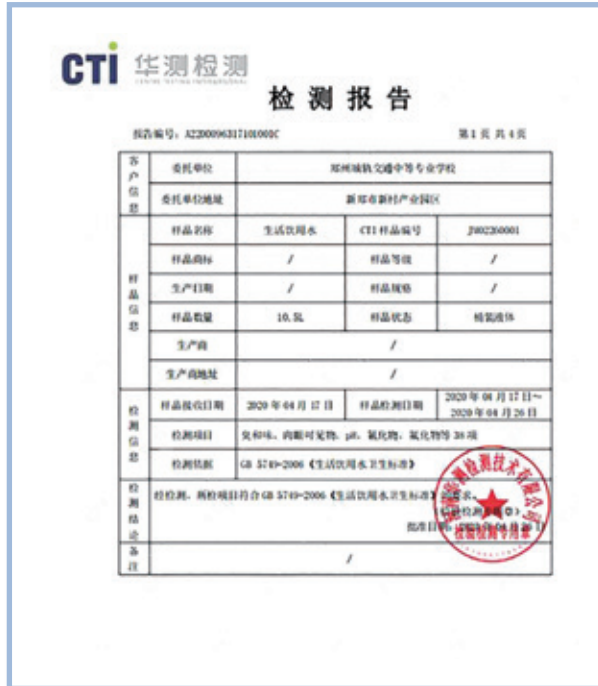
(左圖) 鄭州城軌學校在安裝學校直飲水系統設備時，會要求供應商提供直飲水符合生活飲用水檢測項目的合格報告。