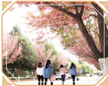
西安鐵道學校加入本集團