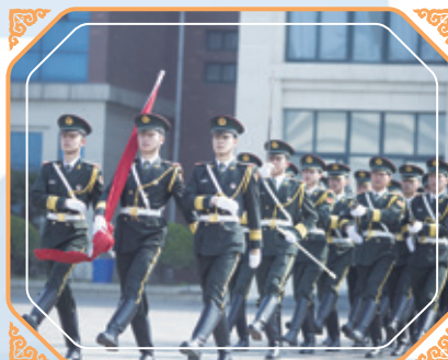
鄭州城軌學院加入本集團