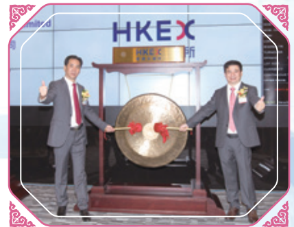
於香港聯交所上市