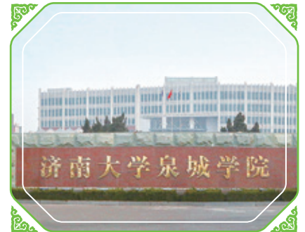
山東泉城學院加入本集團