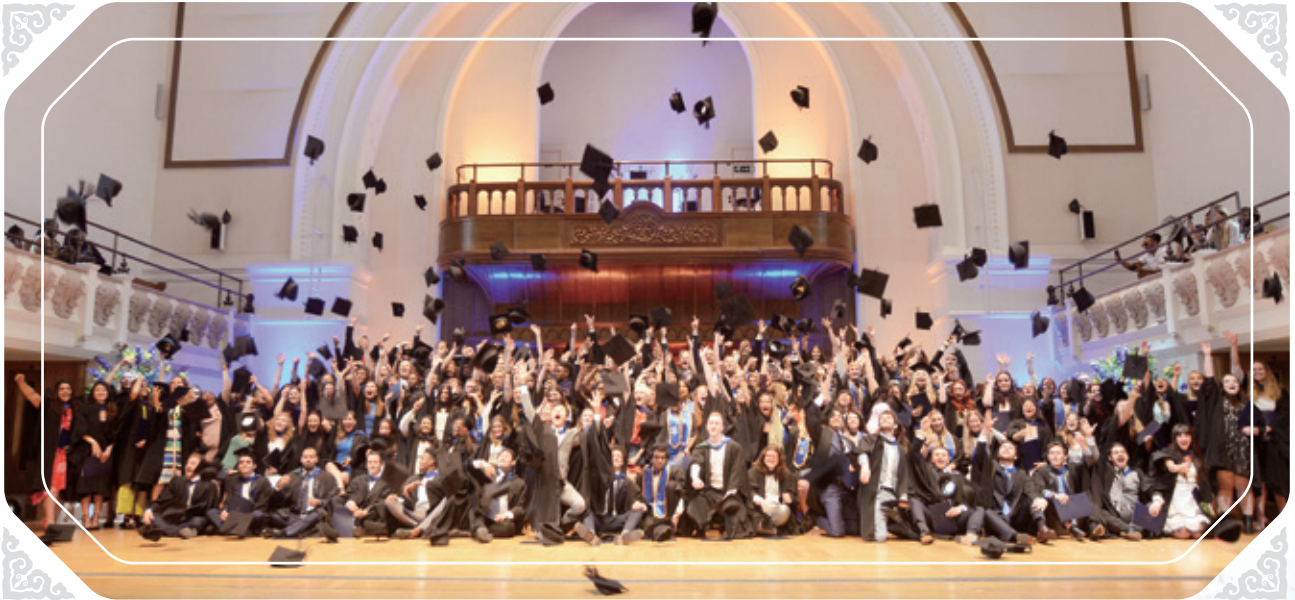
畢業典禮，國王學院