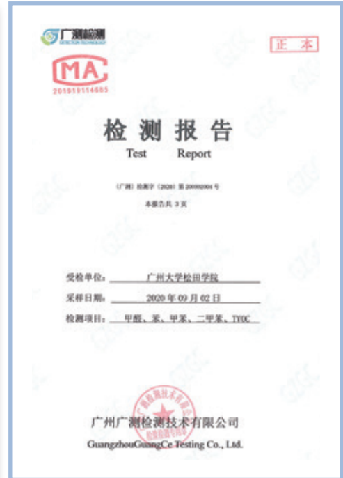
(右圖) 廣州松田學院在圖書館建設時、在新購學生宿舍公寓木床時，會要求供貨商做甲醛測試。

集團旗下各學校採購部門已有一套成熟、完整的供貨商聘用體系。對於採購金額較小的項目，聘用供貨商遵循「效率優先、兼顧質量」的原則，堅持「貨比三家」；比如：小宗物資採購需要取得三個及以上供貨商的報價單並經過校內在線審批流程。而對於採購金額較大的項目，嚴格按照集團及學校制度執行公開招標或競談程序及流程進行公證評選。比如，採購部門需要結合當地市場行情，充分考慮貨物質量和價格(比如，學校所在地區的價格與現行價格進行橫向比較，旗下成員學校的地域優勢進行縱向對比)之後完成選聘工作，從而確保貨物在質量和價格上的平衡和最優化。