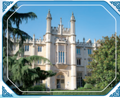
與倫敦里士滿美國國際大學 (英國)合作