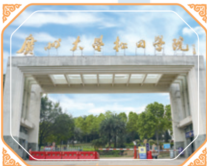
廣州松田學院及松田職業學院 加入本集團