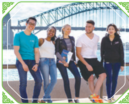
國王學院(澳大利亞)加入本集團