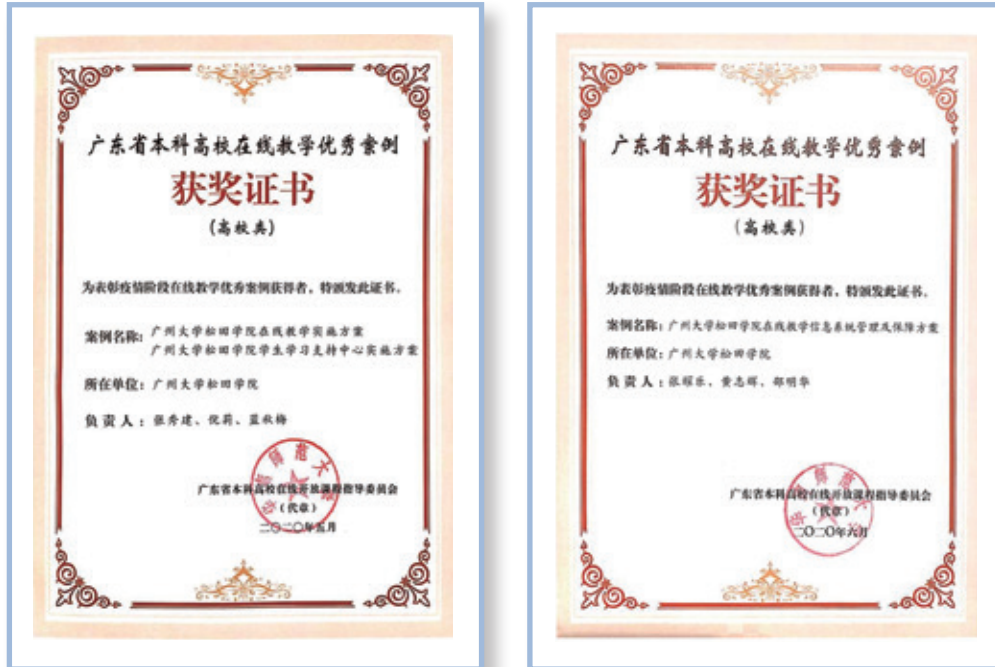
(上圖)廣州松田學院獲疫情階段在線教學優秀案例高校類優秀案例。

各學校制訂了《考試管理規定》、《試卷管理辦法》和《學生學業考核辦法》等一系列管理制度，從根本上規範了考試組織、實施等各項工作，杜絕了人為因素造成的各種考場和試卷安全和保密事故的發生。