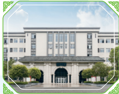
重慶翻譯學院加入本集團