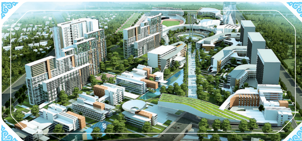
廣東白雲學院的新校區