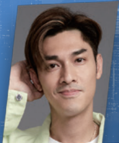
Kelvin Kwan 關楚耀