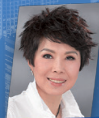
Susanna Kwan 關菊英