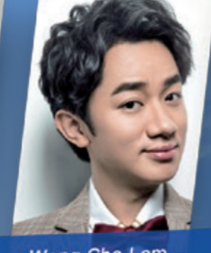
Wong Cho Lam 王祖藍