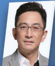
Lawrence Ng 吳啟華