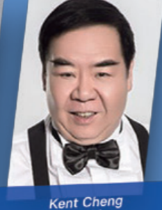
Kent Cheng 鄭則士