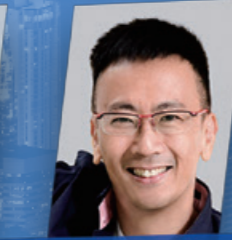
Lawrence Cheng 鄭丹瑞