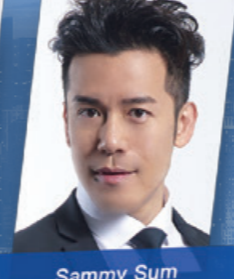
Sammy Sum 沈震軒