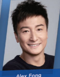
Alex Fong 方力申