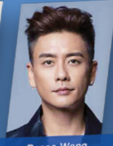
Bosco Wong 黃宗澤