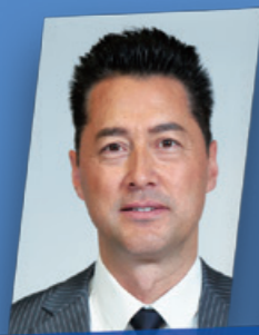
Michael Wong 王敏德