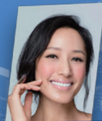
Coco Chiang 蔣怡