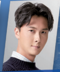
Vincent Wong 王浩信