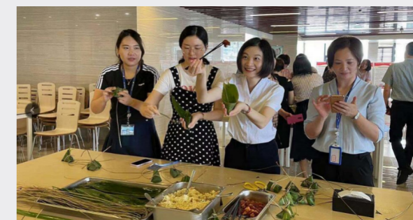
燃料物流公司組織端午節活動