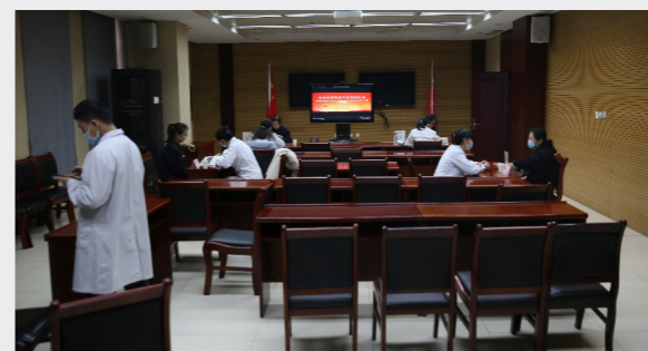
組織員工免費問診活動

5 月 20 日，朔州熱電分公司開展“牽手中國華電 共築綠色家園”品牌宣傳暨公眾開放日活動，30 余名職工家屬代表走進公司，身臨“企”境感受花園式電廠的獨特魅力。漫步在廠區，迎面撲來的是滿樹槐花的香氣，杏樹、棗樹、梨樹引得喜鵲、蜜蜂爭相穿梭，乾淨整潔的經緯路上，滿架的爬山虎營造出陣陣清涼。多年來，朔州熱電一直堅持打造“花園式”廠區，綠化面積占 50%，各類樹木、綠植時刻讓置身其中的職工家屬和媒體朋友感受到蓬勃向上的奮進生命和綠色低碳的清潔理念。