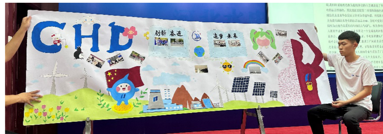
河北華電組織新員工入職培訓