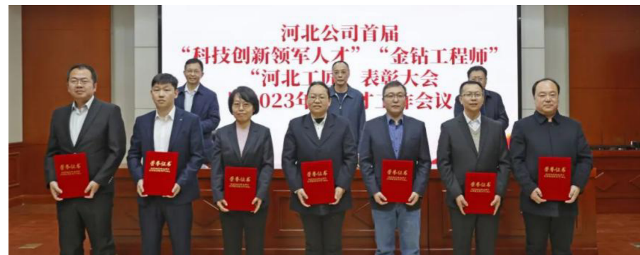
河北公司組織首屆“科技創新領軍人才”“金鑽工程師”“河北工匠”表彰