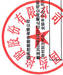
截至2020年3月31日止期间公司所有者权益变动表 (除特别注明外, 金额单位为人民币元)