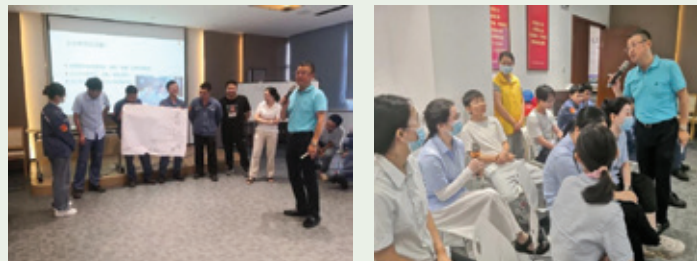
員工心理健康培訓

為進一步加強職工心理健康，提高職工的心理調適能力，本集團開展職工心理健康培訓，邀請心理健康教育專家現場授課，從溝通、衝突、職業輔導三方面開展講解，傳授減壓和心理調適的方法及非暴力溝通技巧，引導職工正確認識自我、緩解壓力、調節情緒，並組織員工分組進行「吐槽大會」，舒緩心情。