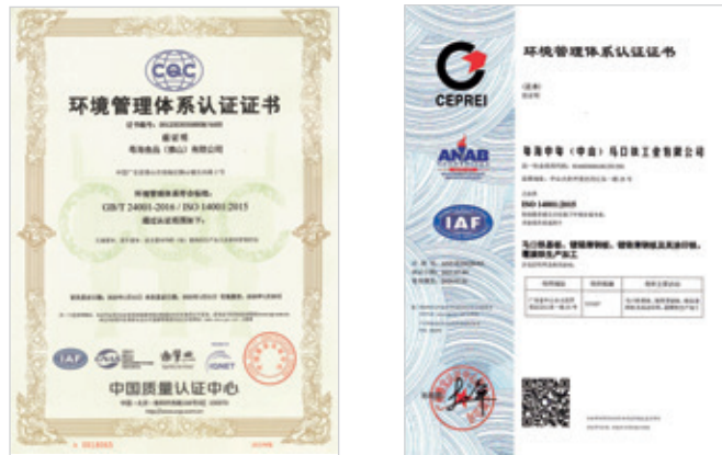
ISO 14001環境管理體系認證證書

為高效地應對突發性環境污染事故、降低環境事故負面影響，本集團遵循《中華人民共和國突發事件應對法》《企業事業單位突發環境事件應急預案備案管理法》等相關法律法規，制定《突發環境污染事故應急預案》，以規範環境事故的應急處理和整改措施。本集團安全生產管理部門負責組織開展隱患排查、重大事故應急處理工作，並定期組織應急演練以確保高效應對突發環境事故。同時，本集團安裝各種監測設備，以實時監控工廠的環境狀況，並在危險化學品儲存地點設置防滲漏池，避免嚴重洩露。此外，我們還擁有具備檢測、保護和通信功能的應急物資，以應對突發環境事件。