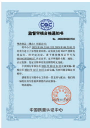
HACCP監督審核合格通知書

本集團涉及食品生物業務的附屬公司已連續多年通過質量與食品安全相關的管理體系認證，包括HACCP食品安全管理體系認證、ISO 9000質量管理體系認證、ISO 22000食品安全管理體系認證等。本年度，我們依據各體系認證標準及要求開展年度復審工作，並獲得中國質量認證中心頒佈的監督審核合格通知書，以確保各管理體系持續有效運行。