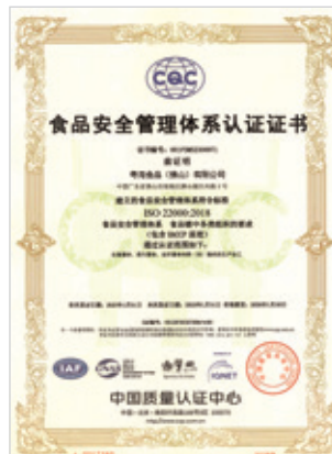
ISO 22000食品安全管理體系認證證書