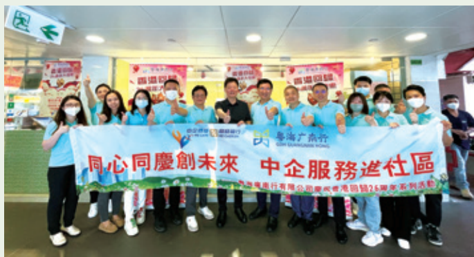
「中企服務進社區」活動

我們積極響應香港中國企業協會號召，精心策劃「同心同慶創未來•中企服務進社區」歡慶回歸主題活動。本集團在港食品零售門店開展整月特價促銷，向街坊市民派發慶回歸「四寶」福袋，以實際行動惠及社區。我們持之以恆植根基層社區，堅守「品質為先、服務至上、誠信盡責、協作共贏」的經營理念，以更優質的產品、更親民的價格服務香港市民，踐行供港擔當。