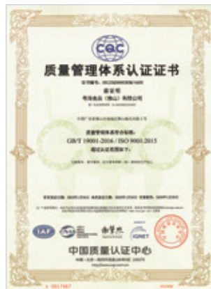
ISO 9000質量管理體系認證證書