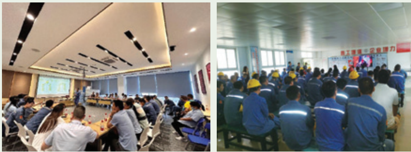
安全知識和勞動技能競賽

本年度，本集團開展安全知識競賽和勞動技能及理論知識競賽，總計880餘名員工參與。此外，本集團於2023全年開展20餘次安全風險應急演練，超300名員工參與，以在安全管理與應急工作中形成常態化處置機制。