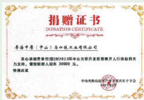
2023年「慈善萬人行」活動捐贈證書

自2021年起，我們每年向中山市火炬開發區捐款人民幣30,000元，支持「慈善萬人行」活動，弘揚博愛精神和生命至上的理念，營造互幫互助的良好社會氛圍，為建設文明社區貢獻力量。