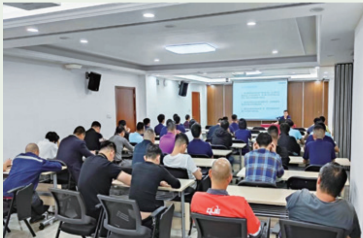
食品安全管理及食品從業人員衛生管理培訓

2023年3月，本集團對參與生產的員工以及現場管理人員開展食品安全管理及食品從業人員衛生管理培訓。培訓內容涵蓋食品安全相關法律法規解讀、食品從業人員個人衛生管理、食品從業人員職業健康與安全等。通過本次培訓，令相關員工深刻了解食品安全相關的主要法律法規及處罰條文，進一步明確生產活動中衛生管理要求及安全行為準則。