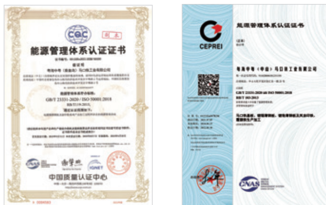
ISO 50001能源管理體系認證證書

核指標，從而提升子公司內外的競爭力。同時，本集團實行三級計量儀表配置，並對應建立能源計量器具台賬，對各生產廠的用能情況進行實時監測。我們安排能源主管和計量管理員定期現場檢查，及時制止異常用能情況、減少浪費。本集團已連續多年通過ISO 50001能源管理體系認證。本年度，我們依據ISO 50001能源管理體系認證標準及要求開展年度復審工作，復審結果顯示能源管理體系持續有效運行。