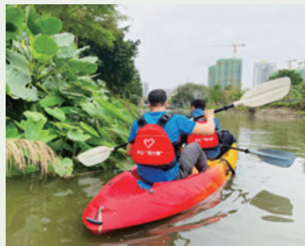
「河小青」巡護河志願服務活動

此外，我們將肉類加工過程中產生的污泥進行處理和稀釋，轉化為植物肥料，對周邊綠植進行施肥，成功實現變廢為寶、植被綠化，減少業務運營對周邊植物的影響，保護生物多樣性。