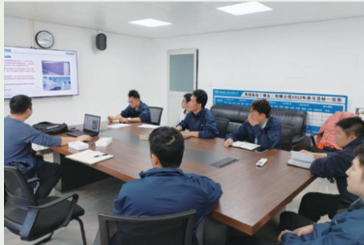
生豬屠宰質量管理規範培訓

2023年12月，本集團對生產部門及質量管理部門的一線管理人員開展生豬屠宰質量管理要點及良好操作規範的培訓。本次培訓使一線的管理人員全面了解食品從生產、加工、包裝、儲存、運輸至銷售全環節的良好工作規範及要求，進一步提升一線管理人員的專業知識水平。