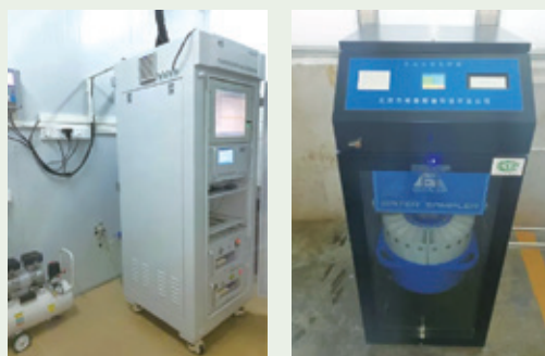
廢水、廢氣自動採樣監測系統

近年來，粵海中粵持續加大環保力度，開展園區雨污分流項目，以及購買廢水、廢氣自動採樣監測系統，旨在進一步提升環境管理水平。2023年2月，廣東省生態環境廳通報廣東省企業環境信用評價結果。粵海中粵在污染防治、生態保護、環境管理和社會監督等方面表現優異，再次獲評省級環境信用評價綠牌企業，是廣東省中山市唯一一家自2016年以來連續六年獲評為綠牌的企業。