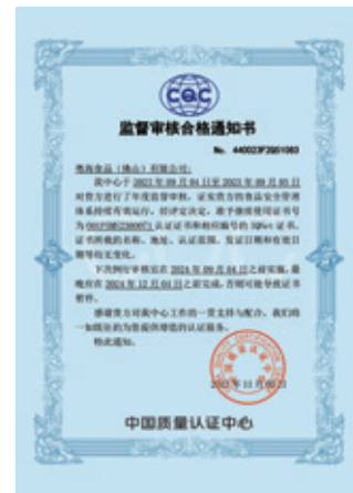
ISO 22000監督審核合格通知書