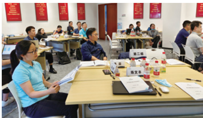
投資業務拓展培訓

為打造符合企業高品質發展的人才隊伍，聚焦員工專業能力提升，本集團充分利用線上平台學習資源，採用線上線下結合的方式，於2023年集中舉辦一系列綜合類專業人才發展培訓。我們面向人力資源崗位員工舉辦面試技巧、人才選拔任用規程和勞動風險相關培訓，助力員工提升人力資源管理技能；面向本集團中高級管理人員舉辦投資業務拓展實務培訓，幫助參訓人員了解業務拓展策略和技巧，識別項目風險並具備制定管控措施的能力。