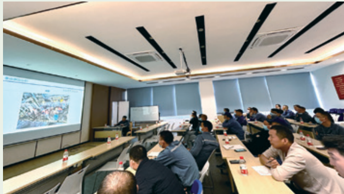
班組安全管理、責任及技能培訓

為提高安全管理水平，本年度我們組織馬口鐵業務安全管理人員開展安全管理、責任及技能培訓，主要內容包括觀看警示教育視頻、分析講解安全事故案例和安全生產知識培訓，幫助員工不斷樹立自我保護意識，增強隱患排查能力，助力實現本集團2023年「零事故」安全生產目標。