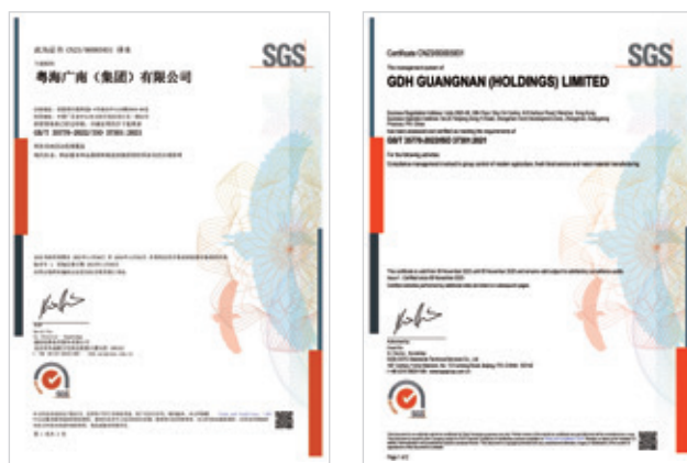
本集團合規體系認證證書

本集團堅持依法合規治企的經營理念，致力於提升企業管治和合規管理水平。本年度，我們召開合規管理體系管理評審會議，評估認為本集團合規管理體系運行有效，滿足現場評審條件，並於2023年10月邀請第三方評估機構對本集團合規管理領域進行GB/T 35770-2022及ISO 37301:2021的合規管理體系認證。認證審核過程中，第三方評估機構審核組專家審查本集團合規管理體系建設情況及對體系的理解和實施程度，並與管理層及各部門開展了訪談。評審認為本集團的合規管理工作符合GB/T 35770-2022及 ISO 37301:2021合規管理體系的要求並有效運行。