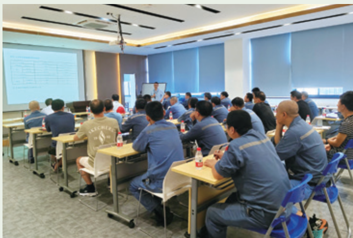
馬口鐵質量管理培訓

2023年11月，本集團對馬口鐵業務負責品質控制工作以及生產車間的員工開展質量管理培訓。本次培訓詳細介紹了優秀同行質量管理實踐，並對比優秀同行主要質量關鍵績效指標，以了解自身在同行中水平及優劣勢、學習同行好的質量管理思路及方法，以進一步完善自身產品質量審核機制、強化生產過程質量控制及驗證流程。