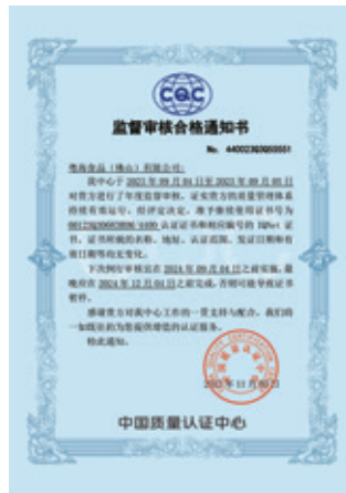
ISO 9000監督審核合格通知書