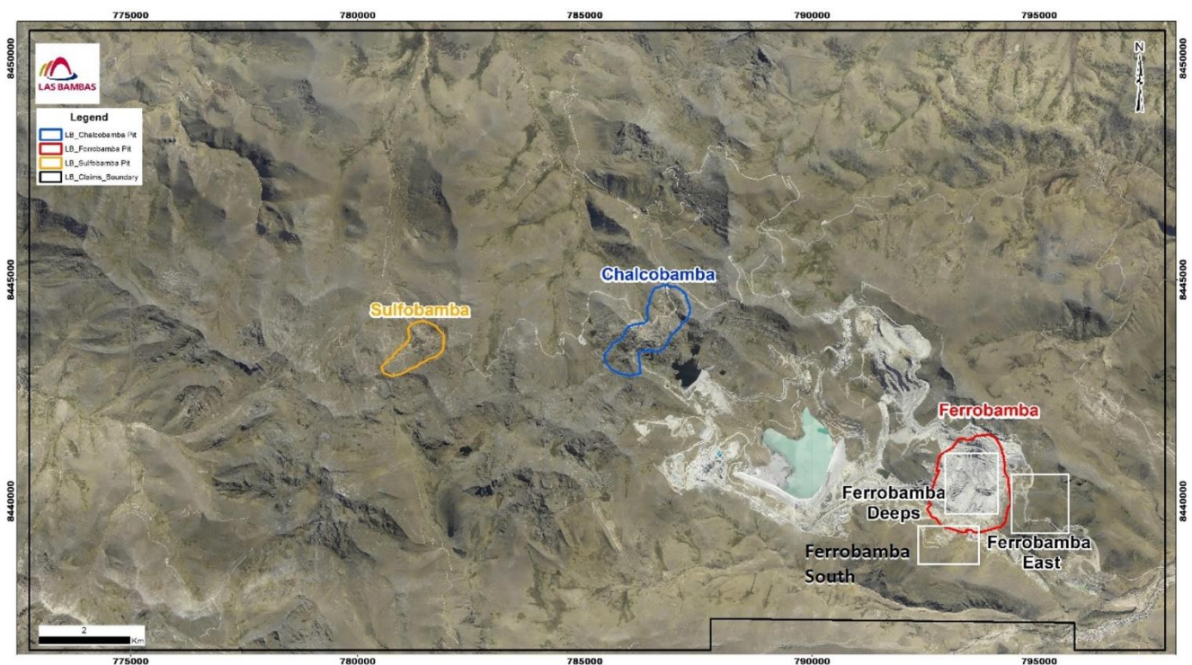
圖 1：包括 Las Bambas 儲量及資源量位置的礦權及 Ferrobamba 深部和 Ferrobamba 東部勘探目標的簡圖。

季內在 Ferrobamba 深部目標已完成十四個鑽孔共 6,269 米進尺。此鑽探工程用作驗證目前在露天礦山開採的較高品位礦化的深度延伸。目標礦化可能作為深化現有露天礦坑或提供礦石以作未來地下採礦作業之用。概念證明研究將於二零二三年第一季度完成。有待進行岩芯樣品分析。