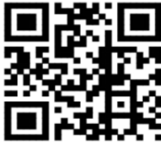
（问题征集专题页面二维码）

（二）投资者可于 2026 年 4 月 8 日 12:00 前访问 https://ir.p5w.net/zj ，或扫描下方二维码，进入问题征集专题页面进行提问。公司将在业绩说明会上对投资者普遍关注的问题进行回答。