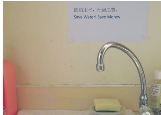
於辦公室範圍張貼提醒節約能源及節約用水的標誌