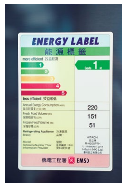
具能源效益的電器