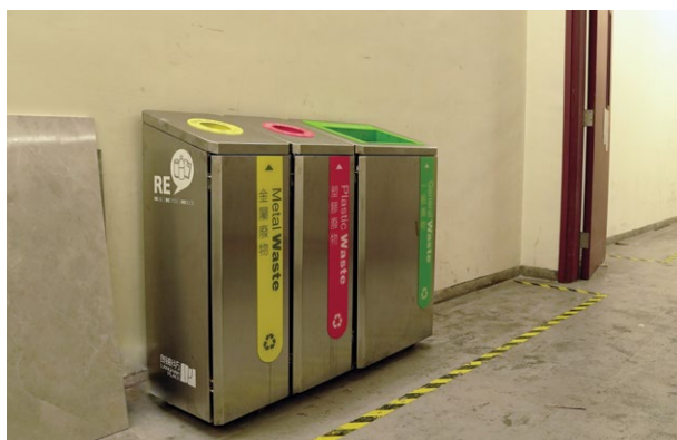
設於辦公室的回收箱