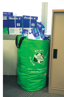
設於辦公室的回收袋