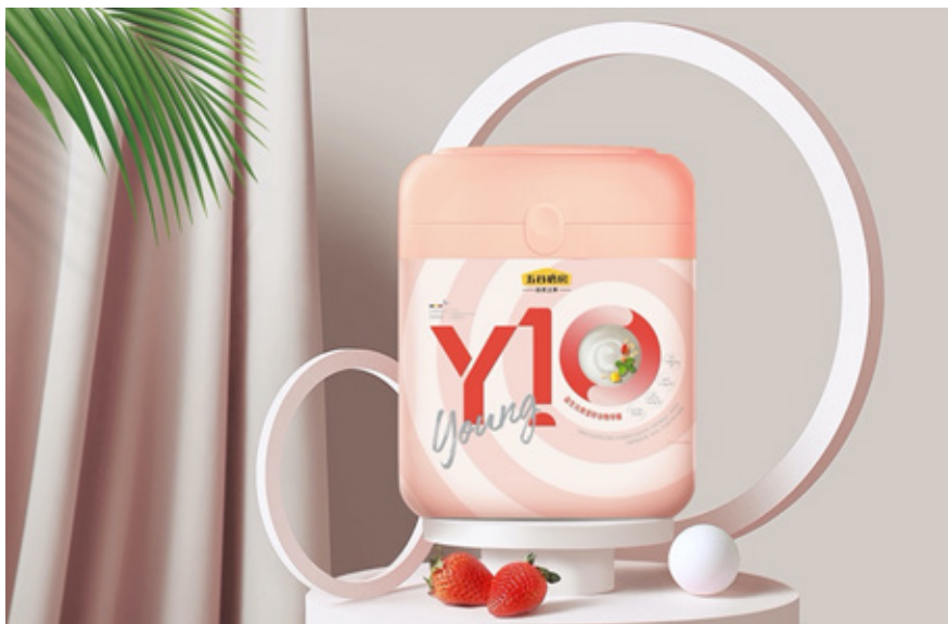
Y10益生元高蛋白沖調穀物粉

天然穀物粉屬我們的核心品類，同時也是本集團最為消費者認可的品類。2020年上半年，我們重點圍繞天然五穀粉的食用便利性及提高可攜性為導向進行產品研發。於2020年3月，我們推出Y10益生元高蛋白沖調穀物粉（「Y10」）。該產品營養均衡、高纖高蛋白、口感豐富，同時做到冷食熱沖，提升了食用便利性及擴大了食用產品的場景。本集團亦推出Y10便攜裝「小穀杯」，為消費者提供更便利的用戶體驗。