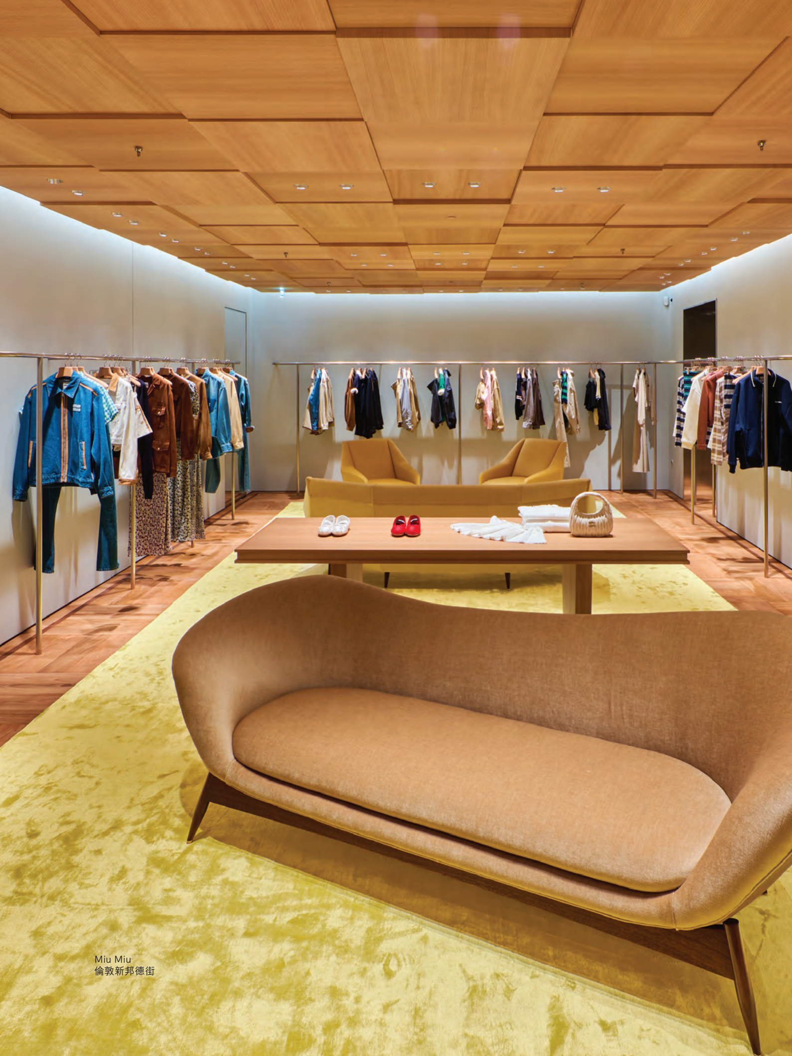
Miu Miu 倫敦新邦德街