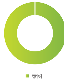
表 2 — 按地理位置劃分的供應商數目

* 於報告期內，當供應商的商品、材料或服務對本集團產生重大影響時，供應商即為活躍供應商。