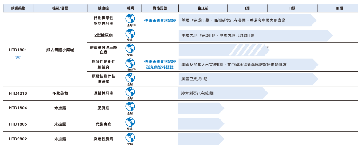
圖：君聖泰產品管線

我們的研發團隊在代謝及消化系統疾病方面擁有豐富的專業知識、深刻的理解及廣泛的開發經驗。在識別旨在調節多通路潛在慢性病的化合物方面，我們的研發團隊處於領先地位，使我們在解決複雜疾病未獲滿足的臨床需求方面具有獨特的優勢。我們的藥物發現成員平均積累11年經驗，團隊成員擁有生物學、藥物化學、藥物代謝與藥物代謝動力學、化學及早期臨床領域的專業知識，其支持我們的產品開發，且全部成員已取得研究生學位。我們的臨床開發團隊由具有豐富藥物開發經驗的科學家及醫生成員組成，參與臨床開發策略制定、臨床試驗方案設計、臨床試驗運營組織、藥物安全監測及臨床試驗質量控制，成員平均積累11年經驗。