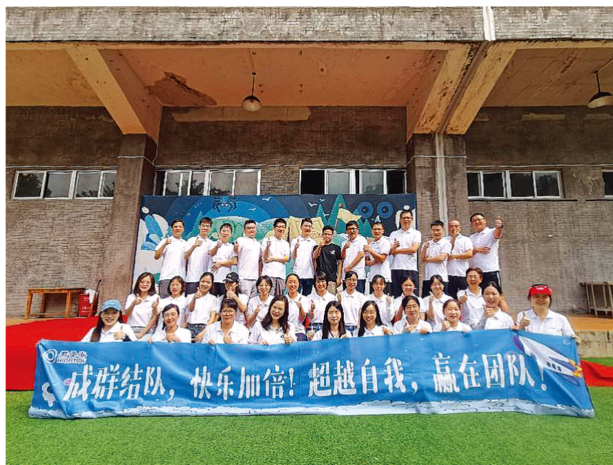
案例：二零二三年九月仙湖植物園團建

我們深刻理解員工遠距離通勤、接送子女等可能面臨的上下班時間問題，公司採取彈性工時制，以協助員工緩解困難。