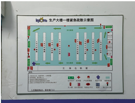
倉庫緊急疏散示意圖

此外，本集團亦會每年組織所有員工參與消防演練，讓員工參與消防演練，使員工熟悉消防逃生步驟，以令員工能在遭遇火災時能最大程度保全自身安全。