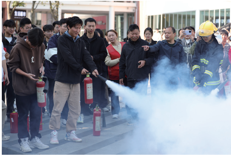
2023年「新華教育、興國為民」消防宣傳月活動

為增強師生的安全意識，我們還組織了多場安全和防火方面的培訓和演練。這些措施共同構成了我們為消除安全隱患所做的全方位努力。