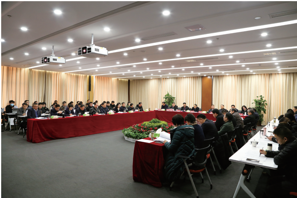
董事及管理人員廉潔教育

本集團堅持以營造清廉、公正的經營環境為己任，在全體員工中倡導反腐倡廉、公平競爭的工作作風，廉潔教育全面覆蓋公司董事和全體員工，不斷加強制度宣貫，本年度重點圍繞財務管理、採購管理、工程管理、法務等方面，通過專題會議和案例培訓等形式，深化員工對反貪污工作的理解和認識，提升廉潔從業的意識和能力，構建公正、透明、廉潔的企業文化，進一步推動公司健康發展。