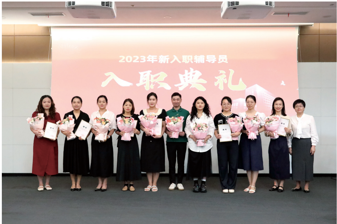
「新華園青春引航人」新輔導員系列培訓暨入職儀式

此次培訓為新員工提供了對工作的深入理解，極大地促進了他們快速融入新環境，加速了他們在角色轉變和個人成長方面的步伐。這不僅為他們個人的職業發展奠定了堅實基礎，同時也為學校的人才培養和隊伍建設作出了重要貢獻。