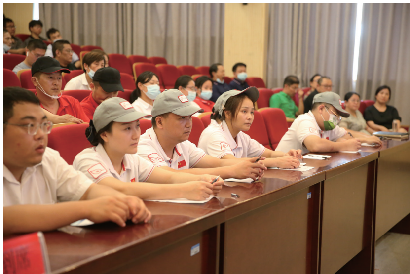
安徽新華學院「食品安全暨服務單位新員工專題培訓」

此外，我們對實驗室和校醫室使用的藥品和化學品實行嚴格的倉儲登記和設備維護制度。全校的消防設備由專業人員負責定期維護保養。我們還為食堂工作人員提供食品安全培訓，並定期檢查食堂的環境衛生和食品安全管理制度的執行情況。