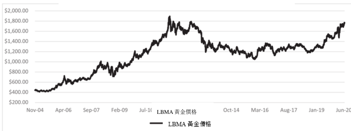
LBMA 金價 – 2004 年 11 月 18 日至 2020 年 6 月 30 日

由於黃金價格的變動預期會直接影響股份價格，投資者應瞭解近期黃金價格的變動。然而，投資者亦需知道黃金價格的過去變動並非未來變動的指標。下圖提供黃金價格的歷史背景。圖表闡明由2004年11月18日股份開始在紐約交易所買賣之日至2020年6月30日期間每盎司美元黃金價格的變動，並自2015年3月20日開始提供的LBMA下午黃金價格為基準，而先前則以倫敦下午定價為基準。