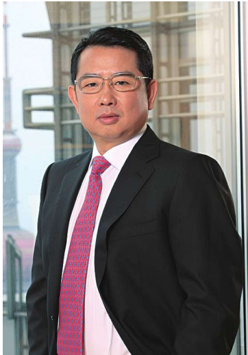
遠東宏信有限公司 董事局主席及行政總裁