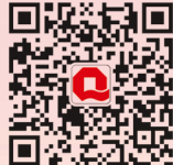
青島銀行 微信銀行