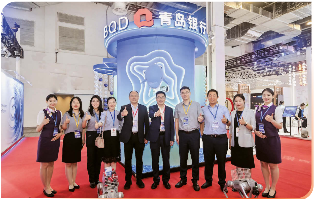
2025年6月18日-20日，本行在2025中國國際金融展精彩亮相，本行黨委書記、董事長景在倫先生(右五)出席活動。

四是打造金融市場業務區域領先綜合服務商。優化客戶基礎，打造高價值同業生態；佈局多元交易，打造多品種交易體系；做優中間業務，發力代客外匯與資產託管業務；優化資產結構，穩定負債來源；構建專業化風險管理體系和團隊，強化投研團隊建設，賦能業務決策。