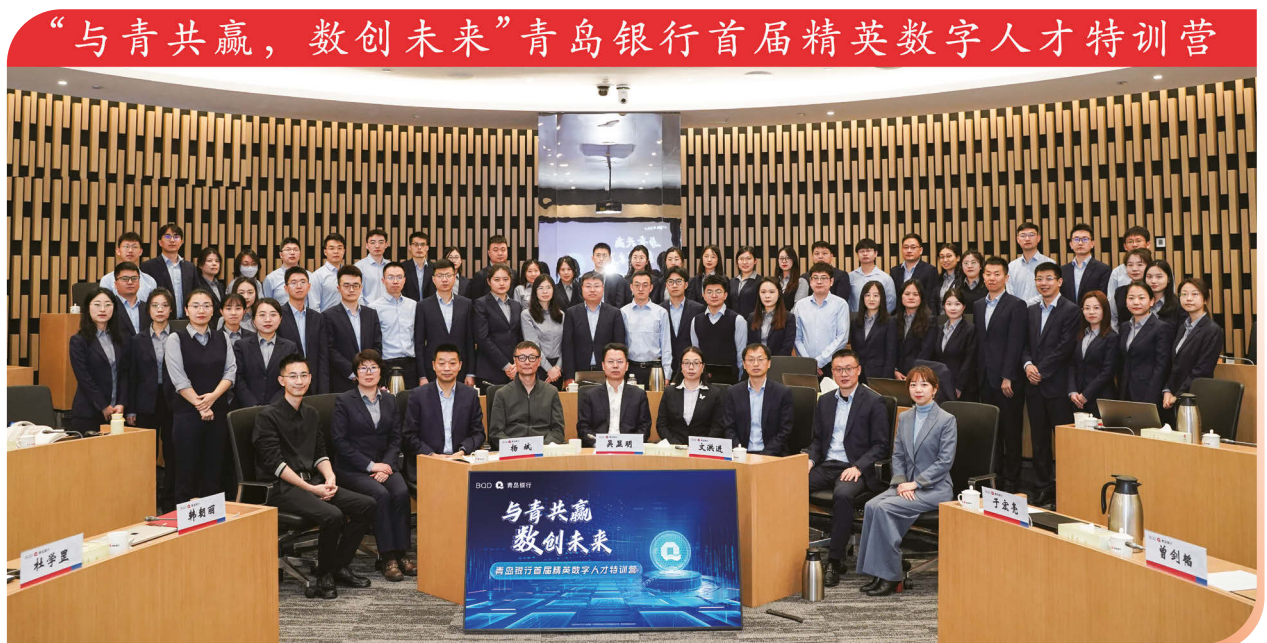
2025年3月24日，「與青共贏，數創未來」，本行首屆精英數字人才特訓營開營。

本行全面深化頂層設計與戰略統籌，迭代升級組織架構與資源配置模式。本行進一步夯實數字化轉型治理體系，將數字化轉型辦公室升格為總行一級部門，統籌轉型規劃與落地實施；設立數字金融部聚焦線上渠道服務重塑與數字化營銷運營體系構建；協同信息技術部門（技術底座）與數據管理部門（數據底座），高效運轉數智板塊「業一技一數」融合矩陣，推動數字化轉型由「立樑架柱」向「積厚成勢」縱深邁進。