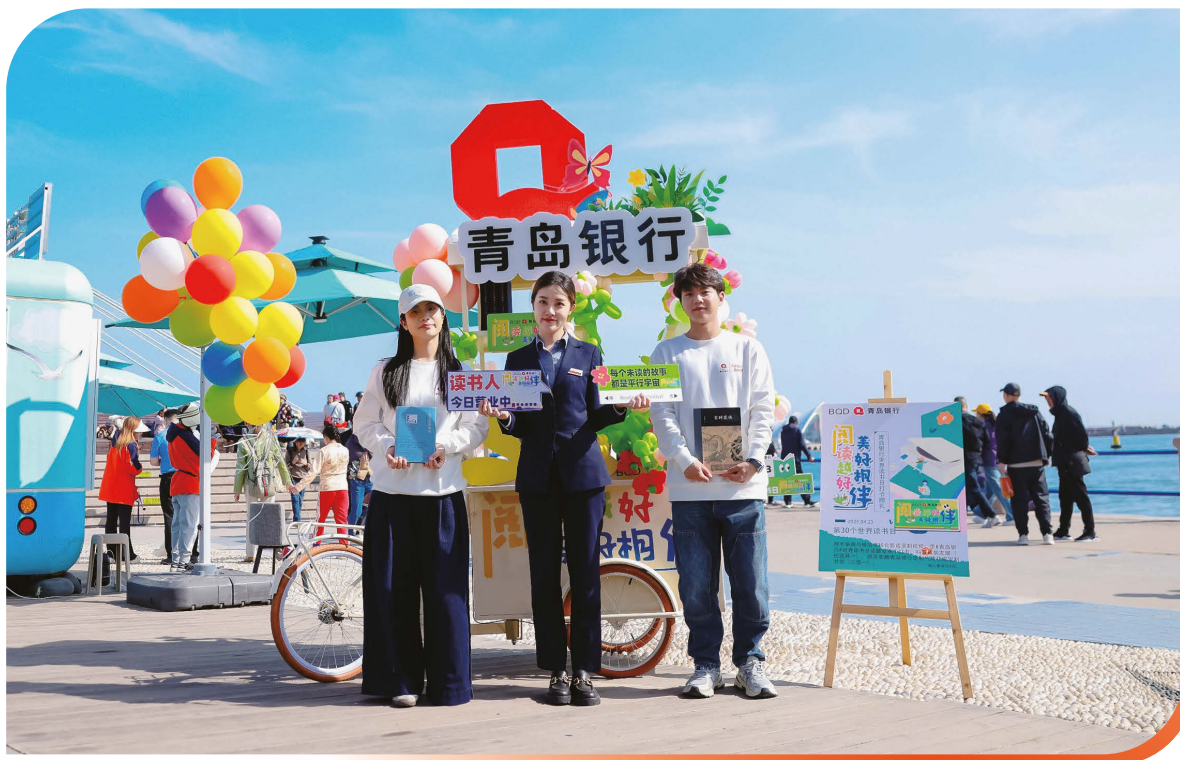
2025年4月23日，書香浸潤島城 美好與春同行——青島銀行閱讀越好·美好相伴2025世界讀書日系列公益活動溫暖落幕。

數字金融發力邁向「數智化」。本行以數字化轉型為抓手，圍繞數智營銷、數智運營、數智風控、數智辦公四大數智戰略重點，聚焦客戶體驗優化，推動數字金融服務提質增效。一是構建「產品+敏捷」雙輪驅動的數字化管理範式，建立「業一技一數」協同機制，深化產品全生命週期管理，本行自主研發的「星圖產品譜系平台」榮獲中國人民銀行「2024年度金融科技發展獎」二等獎；二是建立線上用戶體驗閉環管理長效機制，在統一線上體驗標準與多維評估體系的基礎上，試點「客戶之聲」反饋機制，打通「監測—分析—改進—反饋」全流程；三是持續增強數字化渠道服務能力，成功上線遠程櫃檯二期，覆蓋19項高頻業務，線上客戶規模與業務佔比穩步增長；四是夯實科技自主可控與數據賦能基礎，以提升數據質量為核心，持續完善數據治理體系、強化技術賦能、嚴守安全底線；五是強化企業級AI能力體系，全棧自研統一大模型技術平台，推出「星辰智能助手」等多場景AI應用，賦能業務創新與運營效率提升。