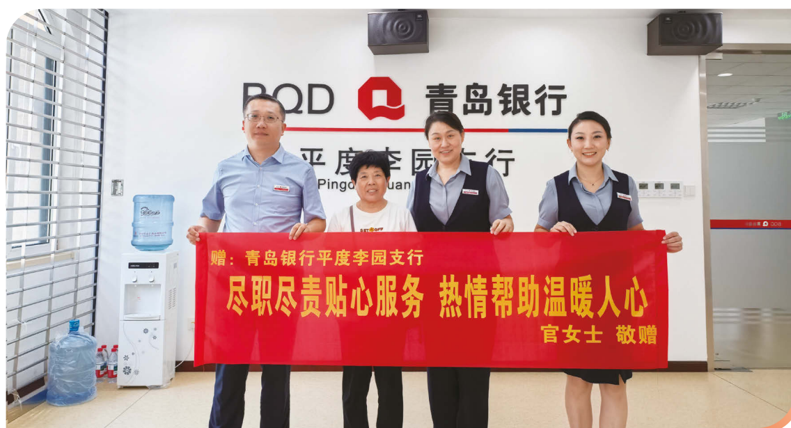
條幅背後的信任與溫度——2025年8月，青島銀行平度李園支行收到客戶贈送的感謝條幅。

推進重點客群分類經營，提升場景化服務能力。社區客群，依託「幸福陪伴」品牌開展系列活動，報告期末，本行社區銀行服務客戶8.23萬戶，較上年末增長1.73萬戶，增幅26.62%；代發客群，重塑代發業務經營體系，搭建外拓市場團隊，錨定代發拓客與客群經營，報告期內累計代發金額達到244.58億元，較上年增加18.37億元，增幅8.12%；社保客群，聚焦社保卡惠民服務和惠民消費，「社會保障卡惠享山東行」活動深度融入商超購物、醫療繳費、交通出行等多個民生服務場景，活動累計參與客戶3.38萬人次，報告期末，社保卡累計發卡量達61.72萬張。