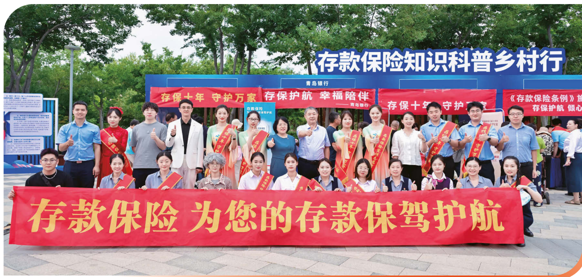
2025年9月18日，本行參加「存保十年 守護萬家」存款保險知識科普鄉村行活動。

關注用戶體驗，持續推動開展服務體驗優化升級。一是本行持續深化「以客戶為中心」的服務理念，推動服務管理向精細化、專業化方向發展，通過深耕客戶關係，經營與打造超預期的感動服務，塑造差異化品牌形象；二是本行客服中心有效實現接通率與滿意度雙提升，為服務品質提升注入了強勁動力。本行委託專業市場監測和數據分析公司開展客戶滿意度調研，報告期內，本行客戶滿意度淨推薦值(NPS)為81.99%，較上年增長1.42個百分點，再創歷史新高，體現了客戶對本行服務的高度認可與信賴。2025年，本行憑借溫馨的客戶體驗、卓越的客戶服務能力，榮獲全球服務領域最高榮譽—第十九屆「五星鑽石獎」(Five Star Diamond Brand)，本行是全國唯一一家連續十年榮獲該獎項的城商行。