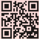
青島銀行 官方網站