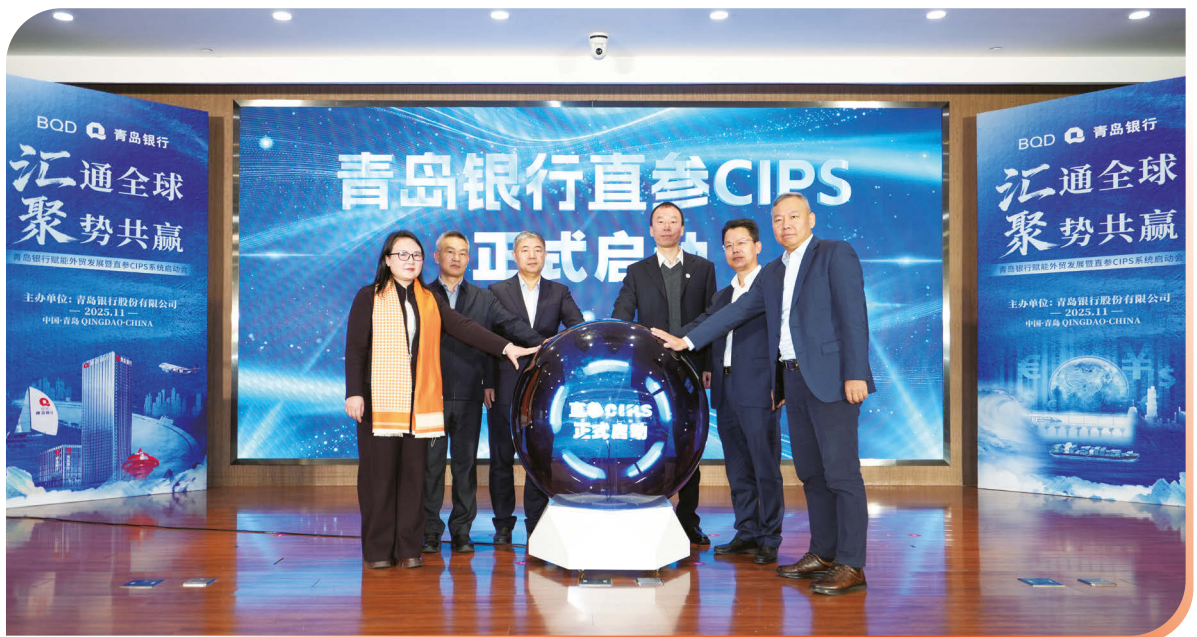
2025年11月1日，本行直參人民幣跨境支付系統(CIPS)正式上線，本行成為山東省內首家獲批CIPS直接參與者資格並實現系統上線的法人銀行。

報告期內，交易銀行業務實現手續費及佣金收入、匯兌收益合計3.60億元，較上年增長8,607.38萬元，增幅31.45%。國際業務活躍客戶4,782戶，實現國際結算業務量222.93億美元，較上年增長46.05億美元，增幅26.03%；跨境人民幣業務量664.23億元，較上年增長60.46%。商票貼現客戶1,316戶，較上年增長37.08%，商票貼現發生額353.81億元，較上年增長55.80%。報告期末，供應鏈金融上下遊客群8,639戶，較上年末增長2,421戶，增幅38.94%；供應鏈融資餘額202.86億元，較上年末增長63.09億元，增幅45.14%；有效現金管理簽約客群20,234戶，較上年末增長6,850戶，增幅51.18%。