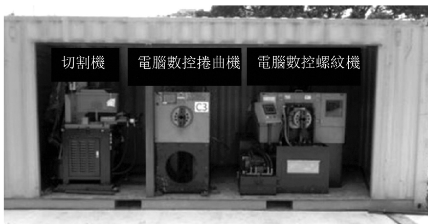
位於車間的三種機械鋼筋並接機

本集團車間消耗的電力為溫室氣體排放的最主要來源。大量電力消耗的原因在於車間用於提供機械鋼筋並接服務的機器的運作，即切割機、電腦數控捲曲機及電腦數控螺紋機，該等機器乃由電力驅動。