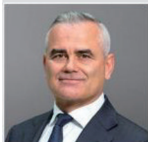
Thomas Gottstein 行政總裁