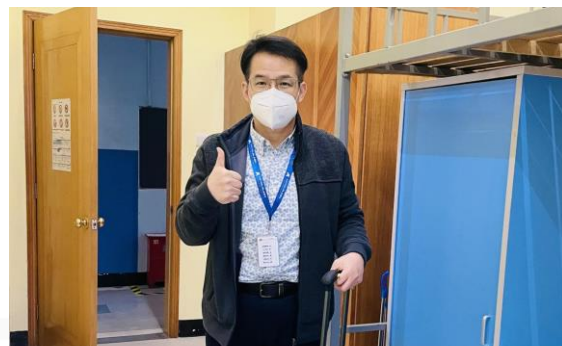
苏州厂总经理 入住生活区