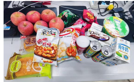
工厂员工收到的物资