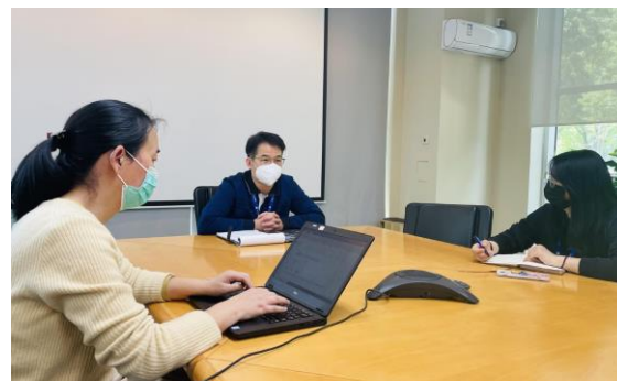
苏州封控应急响应会