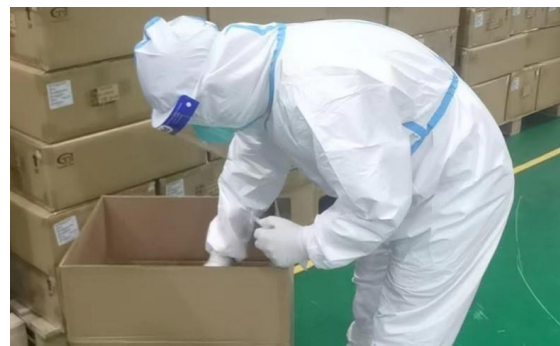
跨境货物内、外包装 核酸检测