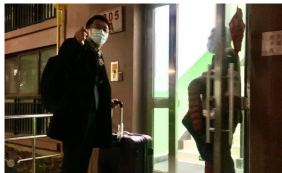
昆山厂总经理 入住生活区