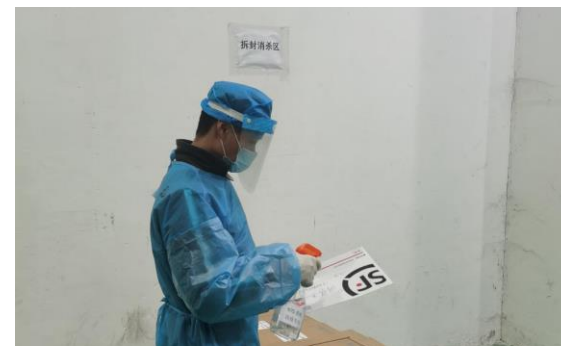
跨境快递、单据 到厂消毒