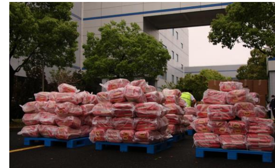
工厂配备物资-大米