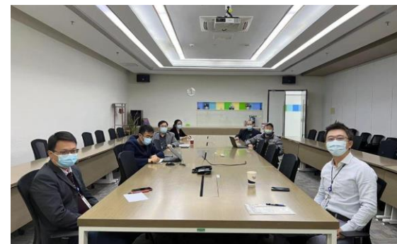
昆山防疫生产会议