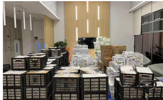
工厂物资配备-牛奶